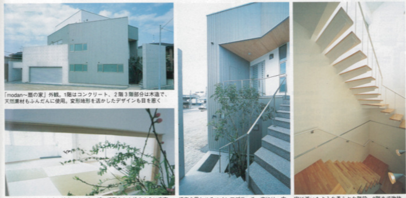
「modan」の家の外観。1階はコンクリート、2階3階部分は木造で、天然素材もふんだんに使用。変形地を活かしたデザインも目を惹く 玄関を開けると、和室の地窓からの光。顔に届いたように光が床に落ちてくる。リビングの人と視線が合うよう、和室は小上がりにつくり 坪庭を思わせるメインアプローチ。夜には、玄関や1階小窓のスクエアの光が影をつける 宙に浮いたような柔らかな階段。3階まで吹抜けの階段室も他の部屋との温度差を感じない

プロにファンの多い会社 年間受注数は限られる 同社で家を建てた人の中には建築界の関係者も多い。プロの厳しい目を見て、納得のできる仕事をしてきた、その証を「言葉」で「言葉」を一言一言と「うち」に決めた」という人もいます。 もちろん「家づくりは初めて」という人も心配はない。土地の検査から資金計画、デザイン、使い勝手など、トータルにきめ細かく提案・サポートしてくれる。そのため同社では年間受注数を限定。一軒一軒、施主の満足のために妥協しない家づくりをしている。 二世帯・地下室・変形地対応力、品質、価格に自信 「住宅は、規格商品で対応できるほど簡単なものではない」と言う同社では、その土地や周りの環境、また住まう人の個性に合わせたベストなプランを設計・提案する。 既存の住宅会社では承えてもらえなかった熱い想いのある人は、同社を訪ねてみてほしい。何らかの答えを用意してくれるはずだ。 また、同社が提案するシステムでは、各工程ごとに信頼のある専門業者に直接発注するため、中間マージンを大幅カットできる。 現場においても、作業をする職人たちに情報がダイレクトに伝わり無駄がない。まさに一石二鳥だ。