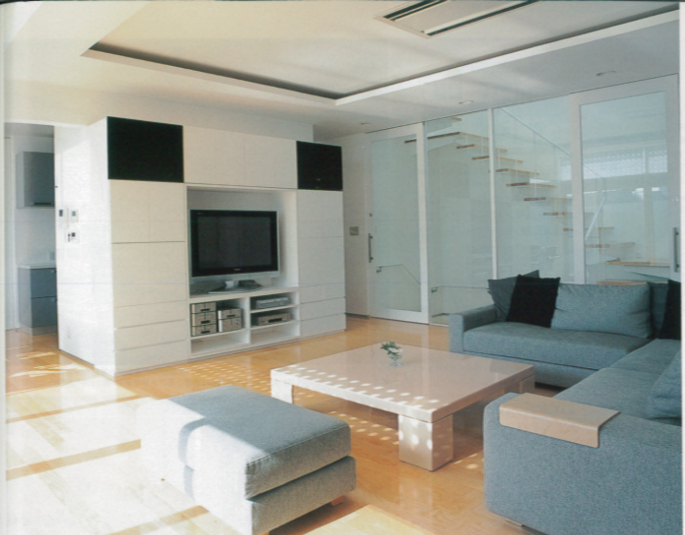
リビングには、バルコニーと階段室の天窓からの光、両側から自然光が差し込む。天井には間接照明。時々刻々と様々に変わる光の表情を楽しむ空間。収納家具は、色味を合わせた造り付け。パントリーや納戸が多く配され、裏には全く生活感が出ない。壁の仕上げ材は漆喰。天然素材を用いながらシャープな空間を実現（写真は全て同社施工例）