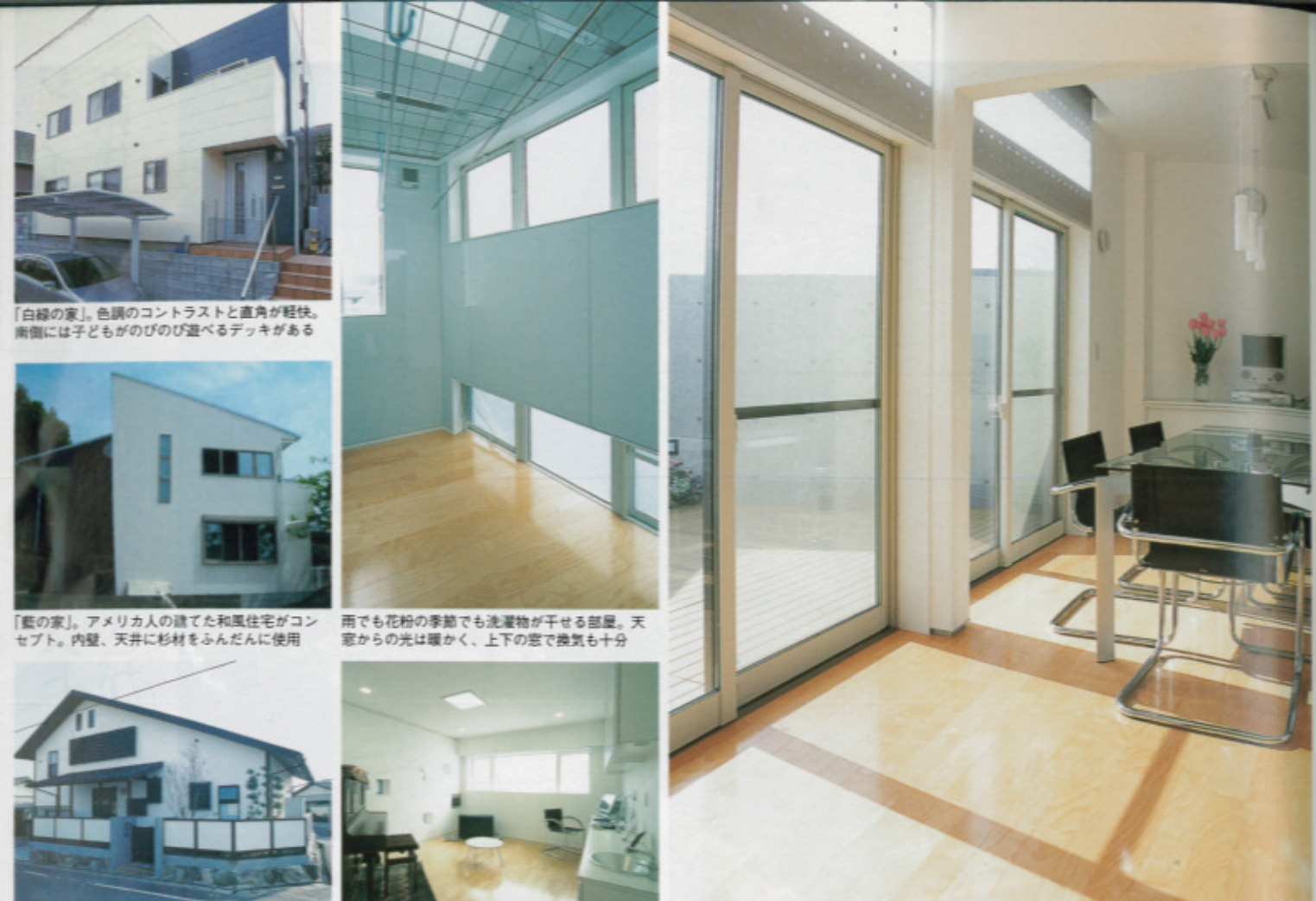
「白緑の家」。色調のコントラストと直角が軽快。南側には子どもがのびのび遊べるデッキがある

プロにファンの多い会社 年間受注数は限られる 同社で家を建てた人の中には建築界の関係者も多い。プロの厳しい目を見て、納得のできる仕事をしてきた、その証を「言葉」で「言葉」を一言一言と「うち」に決めた」という人もいます。 もちろん「家づくりは初めて」という人も心配はない。土地の検査から資金計画、デザイン、使い勝手など、トータルにきめ細かく提案・サポートしてくれる。そのため同社では年間受注数を限定。一軒一軒、施主の満足のために妥協しない家づくりをしている。 二世帯・地下室・変形地対応力、品質、価格に自信 「住宅は、規格商品で対応できるほど簡単なものではない」と言う同社では、その土地や周りの環境、また住まう人の個性に合わせたベストなプランを設計・提案する。 既存の住宅会社では承えてもらえなかった熱い想いのある人は、同社を訪ねてみてほしい。何らかの答えを用意してくれるはずだ。 また、同社が提案するシステムでは、各工程ごとに信頼のある専門業者に直接発注するため、中間マージンを大幅カットできる。 現場においても、作業をする職人たちに情報がダイレクトに伝わり無駄がない。まさに一石二鳥だ。