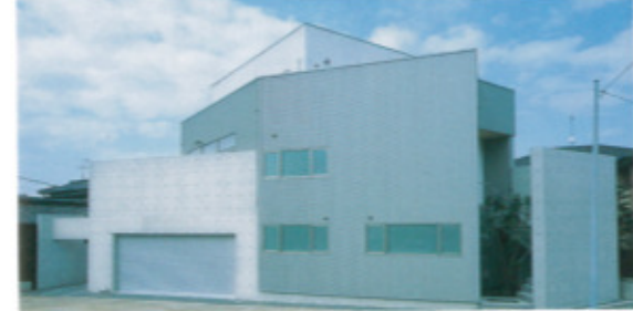
外観。1階は、その質感を施主が好んだコンクリート造。2階3階部分は木造。ビルトインガレージから直接入る家族専用出入り口もある