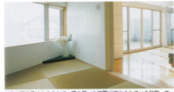
あえて窓を低くすることで、落ちついた空間が演出されている和室。本物志向の同社では、壁に昔ながらの日本の伝統、高級漆喰を用いた

価格目安 ●坪単価/「次世代エコシステム(※後述)」を標準装備した「ハイブリッド健康住宅」が、45坪で50万円~(100%オーダーのため坪単価は目安にとどめてください) ※「生きる」という原点に立ち返って健康、健康に深く関わる「空気」と「水」にこだわり、元気になる住まいを目指しました。「空気」は、最新の空調設備で、「夏暑くない・冬寒くない」を実現。空間に掛かる初期費用も運転費用も抑制します。「水」は、「セントラル浄水システム」を用い、家中の生活用水をキレイにします 商品データ ●工法・構造/木造軸組、RC造、S造、他 ●標準工期/5カ月前後 ●標準仕様/次世代省エネ、外断熱・高気密、二重遮熱工法、オール電化、等 アフター・保証 ●オープンシステムネットワーク専用補償 ●「建築工事保証」「10年間の高圧配管保証」「建物完成引渡し後の補償」など ●アフターケア 不安や異常を感じたらすぐに連絡ください。迅速に対応いたします。 会社データ ●設立/平成8年7月16日 ●資本金/1000万円 ●従業員数/5人 施工エリア ●事務所から40分以内で行けるエリア。遠征管理の可能な範囲(同時期の契約は7棟前後)に限定して頂いております。また、地域外へのコンセプトブック送付は行っていません。ご了承ください ●2004年着工棟数/8棟 ●某住宅会社時代の実績は300棟前後。「建築プランナー」としての実績は、住宅、マンションなど30棟前後。1棟1棟を設計士自らが監理するため、年間施工数は限られますが、施主様の満足第一でやっています。下記HPに施工例や、業界雑誌、建築現場の日報など、写真入りで詳しく掲載中です。 ●宅建業免許/福岡県知事(2)第13598号 ●建築士免許/福岡県知事(第-13)第3209号 ●E-MAIL/info@dan-net.co.jp ●ホームページ/ http://www.dan-net.co.jp