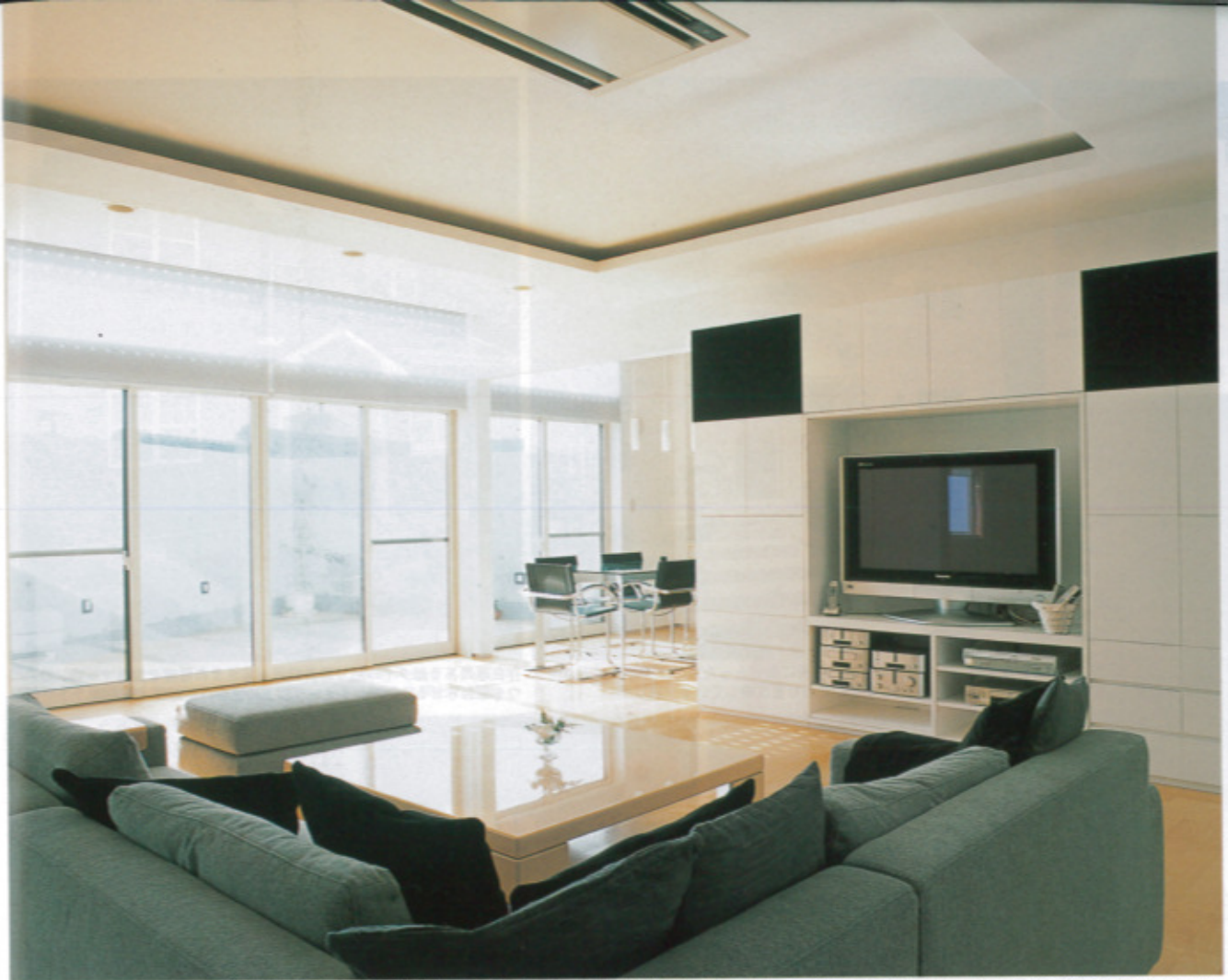
広々としたリビング。奥には、青空を眺めながら食事の出るカフェテラス。すっきりした生活感のない室内は、作り付け家具やパントリーにより豊富な収納力を確保したため。壁一面の窓の外にはテラス、またその外に高い壁があるため、直射日光ではなく、天からの反射光が室内を柔らかく照らし出す(写真はすべて同社施工例。右ページは「麗の家」)

健康で快適な住空間と、美しい家に住まう満足感を両立 「次世代」に対応した品質。「納得」できる価格システム