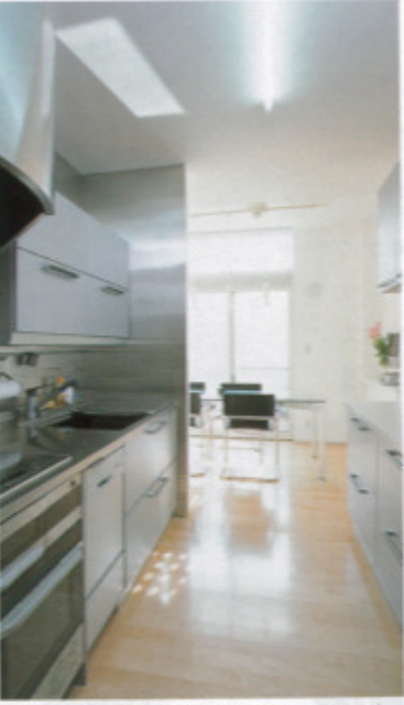
さりげなくリビングから隠されたキッチン。人が集まった時の動線にも配慮されたスペース

「住宅は、規格商品で対応できるほど簡単なものではない」と言う同社では、その土地や周りの環境、また住まう人の個性に合わせたベストなプランを設計・提案する。既存の住宅会社では応えてもらえなかった熱い想いのある人は、同社を訪ねてみてほしい。何らかの答えを用意してくれるはずだ。また、同社が提案するシステムでは、各工程ごとに信頼のある専門業者に直接発注するため、中間マージンを大幅カットできる。現場においても、作業をする職人たちに情報がダイレクトに伝わらぬ状態がない。まさに「二石一鳥」だ。 「プロにファンの多い会社年間受注数は限られる」 同社で家を建てた人の中には建築界の関係者も多い。プロの厳しい目で見て、納得のできる仕事をしてきた、その証と云えよう。「基礎工事を一瞥して、うちに決めた」という人もいるそうだ。もちろん「家づくりは初めて」という人も心配はない。土地の検査から資金計画、デザイン、使い勝手など、トータルにきめ細かく提案・サポートしてくれる。そのため同社では年間受注数を限定。一軒一軒、施主の満足のために妥協しない家づくりをしている。 二世帯・地下室・変形敷地対応力、品質、価格に自信 「住宅は、規格商品で対応できるほど簡単なものではない」と言う同社では、その土地や周りの環境、また住まう人の個性に合わせたベストなプランを設計・提案する。