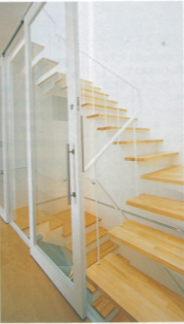
3階まで吹抜けの階段室には、トップライトからの自然光が、1階部分まで明るく降り注ぐ