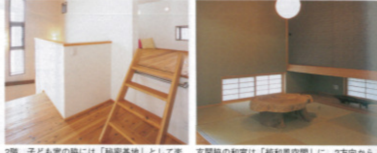
2階、子ども室の脇には「秘密基地」として美しいロフトが。小階段は大工によるお手製 玄関脇の和室は「純和風空間」に。2方向からの地窓の光に、琉球畳の目が映える