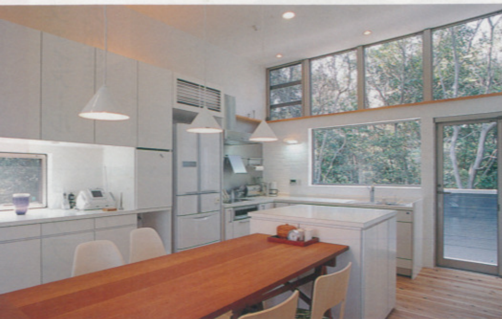
緑を見ながら楽しく家事ができるよう、窓をたくさん配したダイニングキッチン。上部の連窓は規格に合わなかったため、施主の希望により特注でこしらえたもの。部分照明を施した造りつけ収納棚も見事な出来映え（写真はすべて同社施工例）