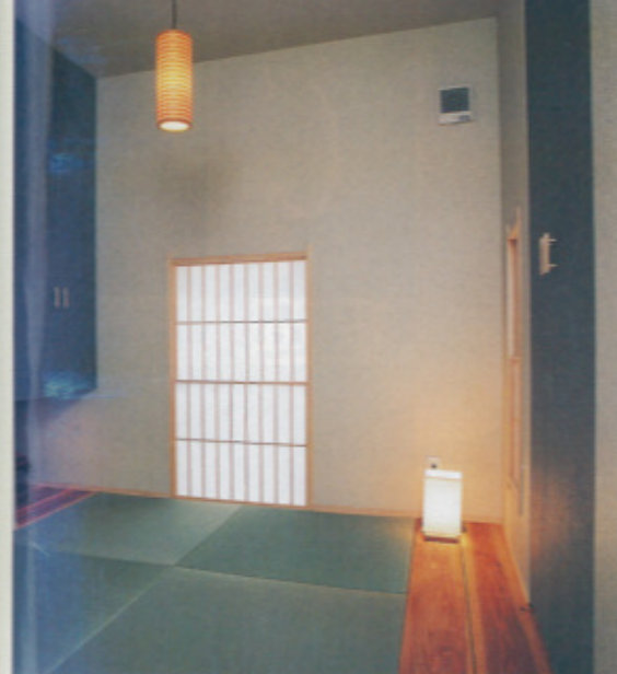
茶室をイメージした和室。地窓からの優しい光に心が和む。板の間にはLDの床材と同じ建材である杉板を用い、家全体の統一感も楽しめる

会社データ ●設立/平成8年7月16日 ●資本金/1000万円 ●従業員数/4人 ●2003年着工棟数/4棟（『片江のハコ』『白の家』『白の家』『モダンプロダクションの家』） ●某住宅会社勤務時代の実績は300棟前後。建築プランナーとしての実績は、 住宅、マンションなど30棟前後、1棟1棟の現場監督ほか、設計士自らが家づくりをサポートするため、年間施工数は限られてしまいましたが、施主様の満足第一でやっています。 ●宅建業免許/福岡県知事（2）第13598号 ●ホームページ/ http://www.dan-net.co.jp ●施工例や業界裏話などお役立ち情報満載 ●Eメール/info@dan-net.co.jp ●メールにて問い合わせの際は、なるべく3日以内に何らかのお返事をするようにしています。もし連絡がないときは、お手数ですが再度ご連絡ください。