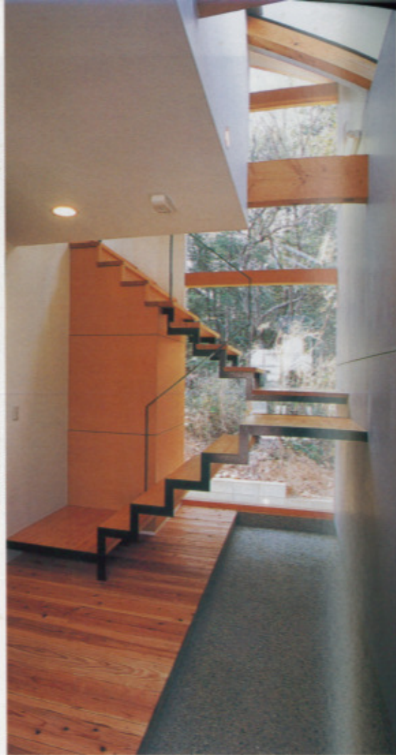
玄関を開けると目に飛び込んでくる現代美術のオブジェのような階段。施主が描いたスケッチを基に、強度と美しさを満たすよう設計したもの