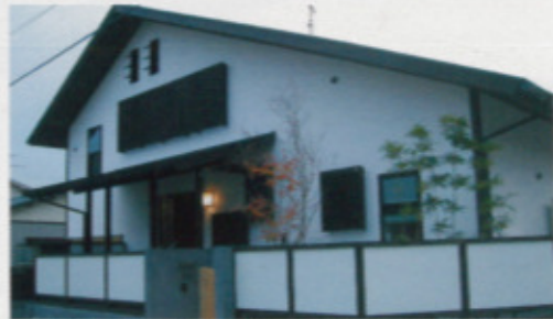
施工例／「modan〜民三調の家」。柱や垂木を枯流風に、外壁は漆喰でまとめた。世紀を重ねた古民家といった風情が郷愁を誘う