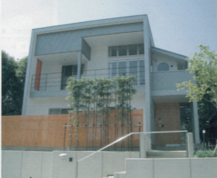
木造住宅とは思えないモダンな外観。外壁には、耐食性・耐熱性に優れたガルバニウムを採用。ネオマフォームを用いた外断熱と二重通気工法で、夏も快適な室温と台風でも静かな室内を実現

「二期一会」がモットー スタッフ 気さくで信頼できる 経験豊富なパートナー 「一期一会」がモットー。スタッフは気さくで信頼できる経験豊富なパートナーです。建築が好きで、施主の夢を叶えたいという同社では、土地のことから資金のことまで何でも気さくに相談のしてくれる。「何でも言ってやれという勢いで、安心して夢をおいかに話してください。それが私たちの原動力にもなります」とのこと。 相談からラフプラン提案まで無料。契約は提案を気に入ってから。契約後は納得するまで打ち合わせできるというのも嬉しい。 二世帯、中庭、変形地形 和風、洋風、カントリー そして同社では、建築士が上から一方的に自分の考えを押しつけるというふうなことがない。「施主の家づくり」のパートナーという位置づけで、どんな要望に対しても対応するプランを、経験豊富な一級建築士が作成。分かりやすい模型を作り、施主が納得のいくまで何度もプラン提案をする。 また、土地の検査や資金計画、工程管理、アフターフォローまでトータルにサポート。そのため年間受注数は限られるが、引き渡しの時は「娘を嫁に出すような心境」というぐらい家を大切にしている。