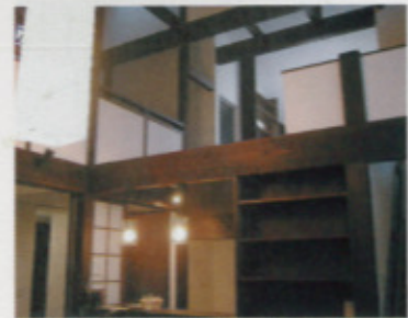
天井までの吹き抜けは、懐かしい雪国風の中に、機能性の加味された安らぎの空間となっている