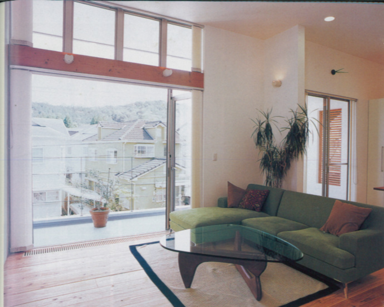
天井高3.2mの2階リビングには、全開口型サッシ採用。その開放感は一とさわ。冷暖房効率が気になるころだが、自社開発の「1層まるまる暖房」は、熱源を床下に設置し通気設計をしたもので、イニシャルコストもランニングコストも抑えたまま家全体を暖める優れたもの。外断熱、複層ガラス、断熱サッシ採用で、次世代省エネ基準もクリア