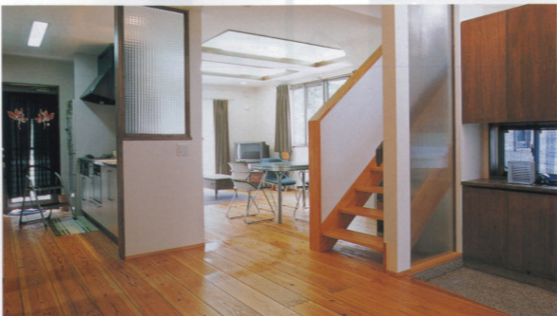
「大好きなアメリカのユーズド家具が調和して様になる」と施主も大満足の空間は玄関からひと続き。床は足場板を利用した無垢の杉で厚さ30mm。木目に味があり優しい足触りだ。リビングは振り込み天井に間接照明を入れ、支脚やキッチン脇のガラスは編み目模様。光と影のコントラストが妙味