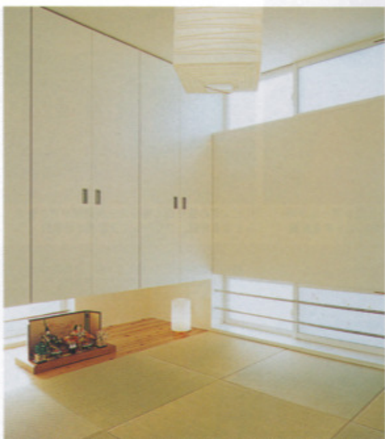
リビングに隣接する和室。上下に配置された窓からは日中を通して明るい日差しがさし込む。白で統一されたつくりつけの家具は収納力も抜群