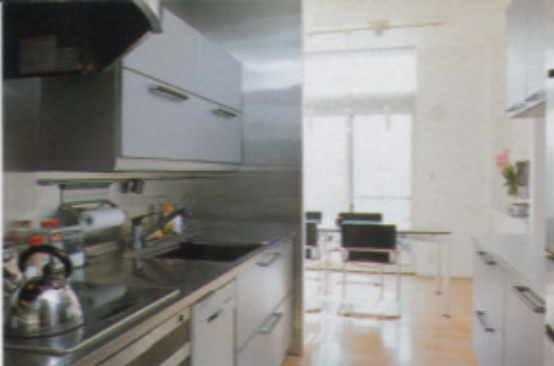
機能的で使いやすいキッチン。リビングダイニングへのスムーズな動線が確保されているが、リビングからはさりげなく隠されている