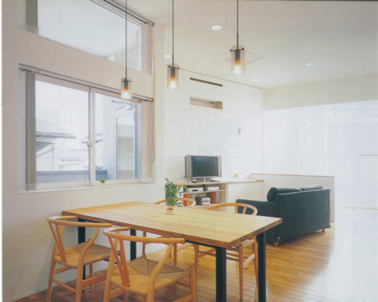
外光が降り注ぎ、そよ風が通り抜ける暮らしをイメージしていたオーナーは迷わず2階リビングを選択された。階段は昇り降りが苦にならないよう、細かな心配りがされている。写真奥の全面ガラスは、自然光を最大限に活かすためにすりガラスを採用。天井高3mという大空間に独自の光が柔らかくさし込む（写真はすべて施工例）