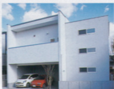
2階リビングで2台分のビルトインガレージを確保。隠れたメリットを活かす設計はさすが