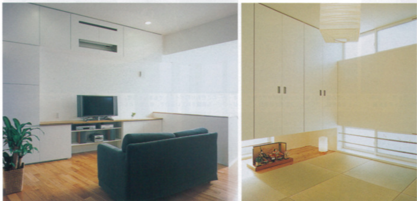
リビングの全面にもつくりつけの家具が配置されている。ビデオやDVDなどで散らかりがちなテレビまわりもスッキリと片つきそう。生活を始めた今でも、収納力にはまだまだ余裕があるそうだ