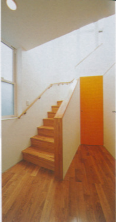
オレンジのドアには、壁の中を暖気が伝い家全体を暖める「一様まるまる暖房」のユニットが