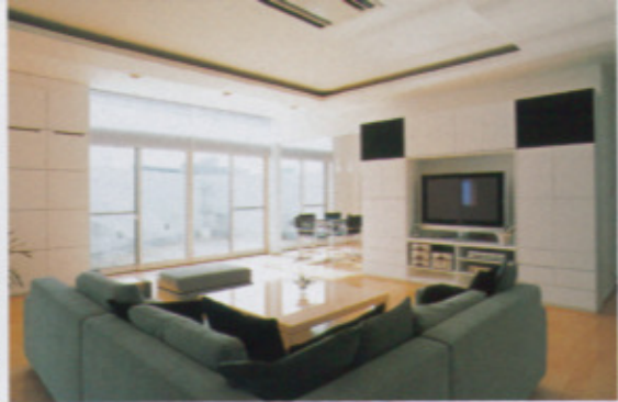
天井面までの大きな開口部を設けており、光が溢れるリビング。写真奥にはカフェテラスがあり、外への開放感がうれしい