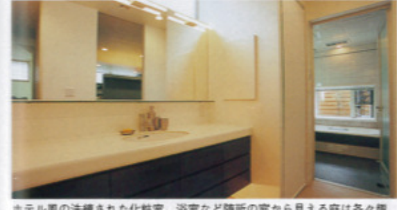
ホテル風の洗練された化粧室。浴室など随所の窓から見える庭は各々庭が異なりさりげない見せ場(右ページ写真5点は「機手の家」)