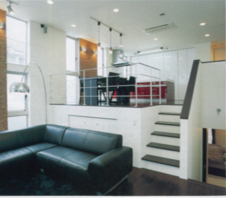
スタジオカクショールームのようなセンスあふれるリビングダイニングキッチン。リビングは振り込み車庫の上の中2階で天井高は3.6m。キッチンの背面も収納で生活感を出さずに暮らせる