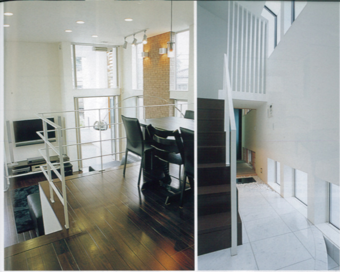
2階フロアのダイニングキッチン。リビングの天井まで取った窓から屋外にも視界が開け、開放感があふれている。左手前(写真外)は子どもスペース。手すりの下部はリビングから使う収納

第三者機関が厳しい検査で引き渡し後10年間保証 (財)住宅保証機構の保証付。 ■性能保証...設計図書、施工の要所要所、完成時に検査を行い、基本構造部分の瑕疵については10年間、仕上げの剥離や建具の変形等については2年間保証 ■完成保証...万が一、業者が倒産などで工事が中断したら、前払い金の損失や追加で必要な工事費用を保証 ■地盤保証を付けることも可能...地盤工事着工から引き渡し後10年間、不同沈下に対して保証 つくり手として愛着も責任感も強くアフターケアもフットワーク軽快 家の価値は暮らしが始まってからが本番。施工上の不具合はもちろん、ライフスタイルとのちょっとしたズレでもなんでも、異常や不安を感じられたらすぐにご連絡を。