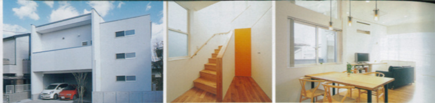
住宅地なので、通りに対しては閉鎖的な外観。右手の3つの窓は1階リビングと2階の和室の足元と天井近くにしたもの(3点は「若久の家」) オレンジのドアの奥は、壁内を暖気が伝い家全体を暖める「1棟まるまる暖房」のユニット 2階リビングは天井高3m。壁面を切り取った窓は枠を設けずスッキリスマート。右手奥は全面すりガラスで和らいだ光が部屋中に広がる