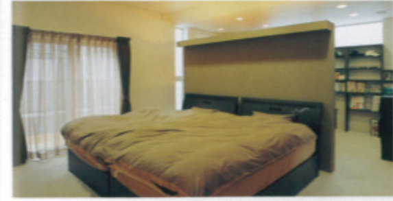
1階フロアの寝室。天井高は2.6mあり、ダウンライトの抑えた演出で深いくつろぎを感じる。奥はクロゼットと書斎スペース