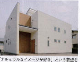
「ナチュラルなイメージが好き」という要望を受けてシンプルでさわやかな雰囲気の外観に

う心がけています。暮らしやすさに彩を添えること。それが家族の笑顔につながると思っています。naomiの設計秘話が多数紹介されているブログもぜひ確認を。