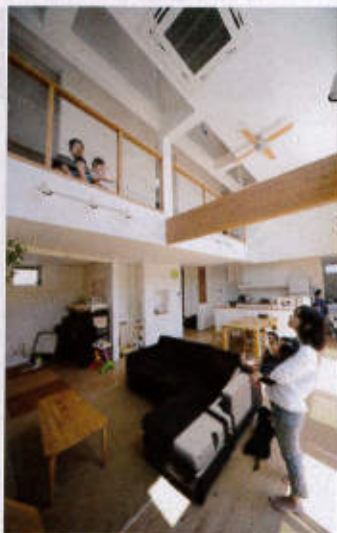
2階の子ども部屋から出たらすぐに分かるはめ込みガラスの手すり壁。会話もしやすい