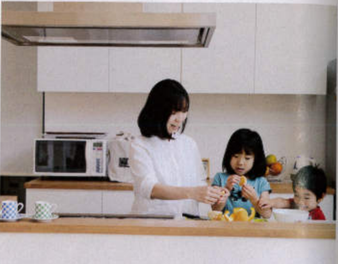
食は家族の元気の源。だからこのキッチンを家の中心に配置して、子どもたちが自然とお手伝いできる動線をつくる。キッチン横にはパントリーや洗濯室があるから家事が楽

インテリア naomiが提案する ビュー 笑顔を生む設計 「毎日の暮らしに必要なこと…食事や洗濯など、生活スタイルがぐんと便利になるプランをおつくりします。そのために、それぞれのご家族の行動パターンや趣味嗜好を細かく聞かせて頂き、家の中のいる人々で会話や多彩なシーンが生まれる仕掛けをつくるよ