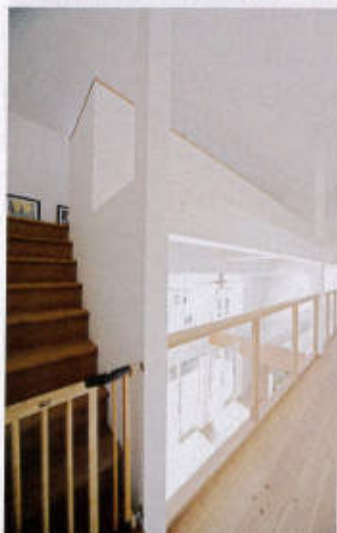
収納部屋にしても隠れ部屋にしてもOKな傾斜天井のフリースペースへは2階から階段で