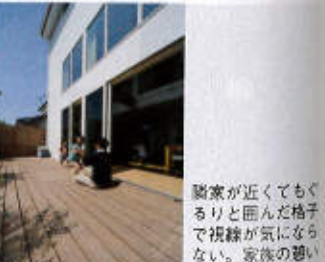
隣家が近くてもくると丸んだ格子で視線が気にならない。家族の憩いのスペースだ