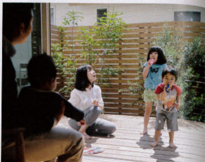
ウッドデッキは家族のセカンドリビングとして大活躍！ここからはリビングはもちろんキッチンも見えるから、子どもたちはパパママに見守られて安心して遊べる