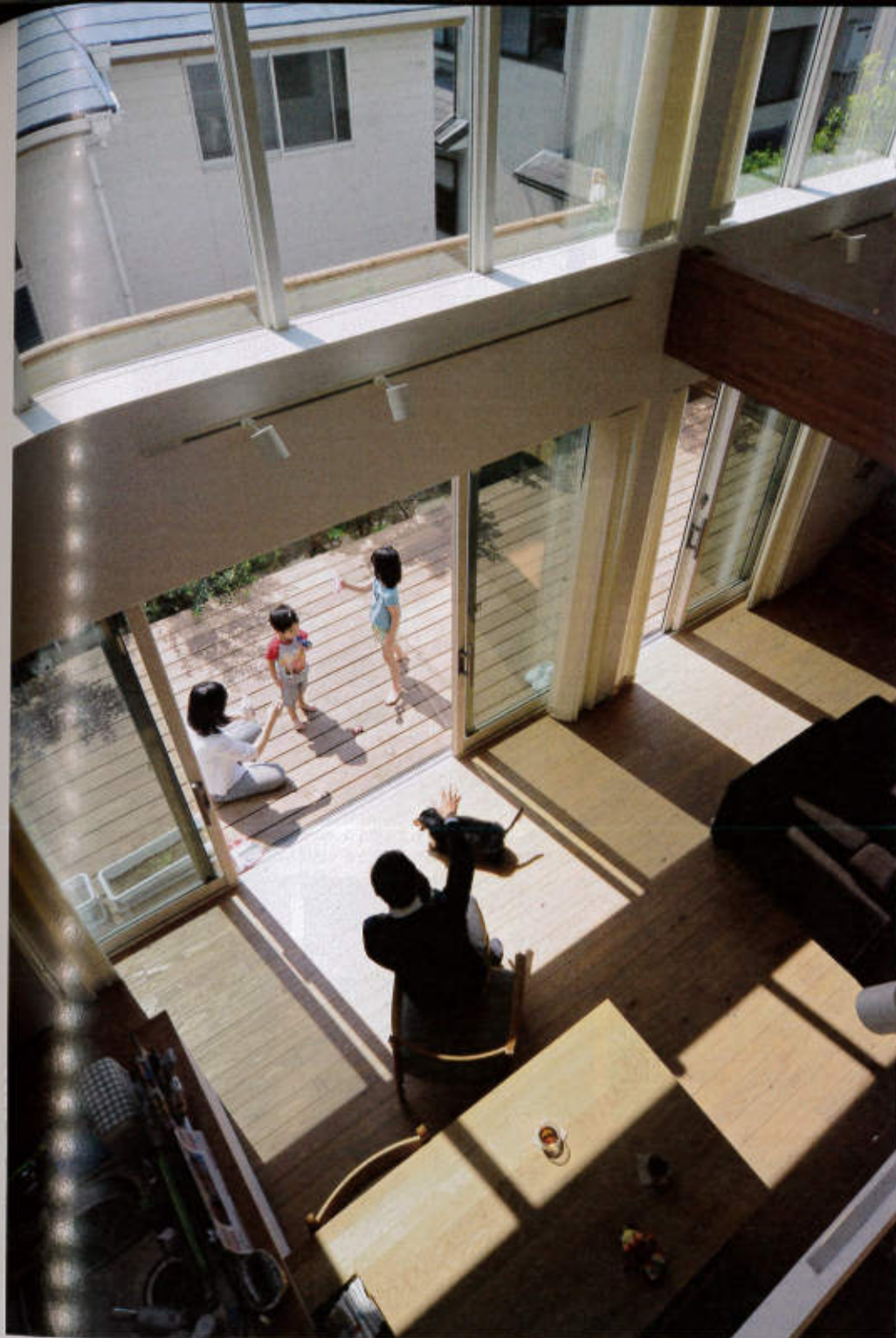
広いウッドデッキは室内のフローリングと同じ素材で段差なくつなげ、広がりを感じ、格子と植栽で隣家との境をつくることで、思った以上の広がりが出たそう。方角と高さも考えてつくられた吹き抜けの窓からは家の奥にまで光が届き、室内が明るくなる。(見開き写真はU邸)