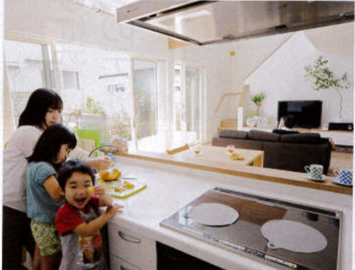
キッチンからは家中ほとんどが見渡せ、家族といつでもコミュニケーションがとれる。外断熱・二重通気工法の「1棟まるごとエコ暖房」だから開放的な開閉りでも夏も冬も快適！